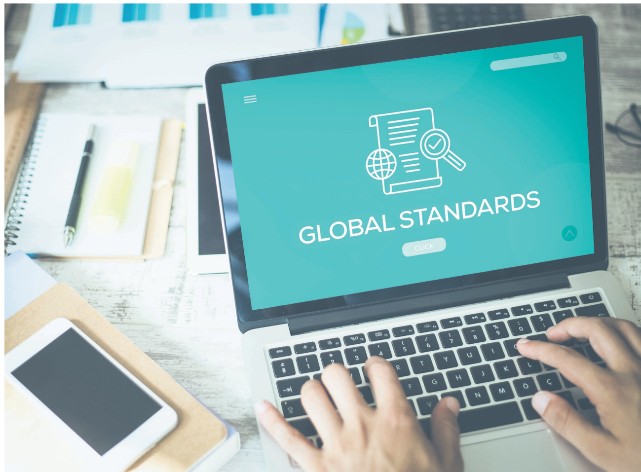
Der Finanzplatz Liechtenstein richtet sich strikt an international anerkannten Rechts- und Steuerstandards aus.

Das Einhalten dieser Standards wird regelmässig durch internationale Gremien geprüft und ist ein Gradmesser im Vergleich mit anderen Finanzzentren dieser Welt. Ende letzten Jahres wurde Liechtenstein im Zuge eines Audits vom Expertenausschuss des Europarats Moneyval auf die Einhaltung der internationalen Standards bei der Geldwäschereibekämpfung