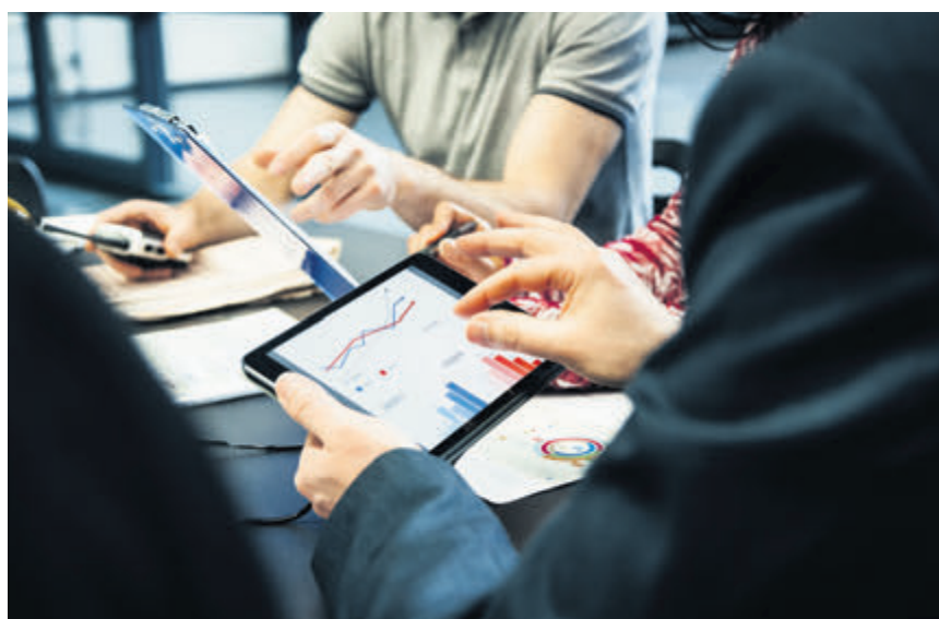
Interim-Manager üben ihre Rolle zeitlich begrenzt aus.

Das Projekt lief gut und konnte trotz eines sehr knappen Zeitplans durch die Erfahrung des Interim Managers termingerecht, im Budget und mit dem gewünschten Umfang eingeführt werden.