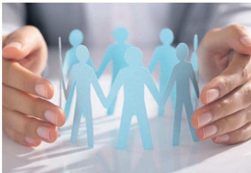
Durch soziale Innovationen sollen neue Antworten für globale Herausforderungen der heutigen Zeit gefunden werden.

Als Möglichkeit zur Verwirklichung der gesellschaftlichen Verantwortung von Unternehmen wird aktuell das Thema